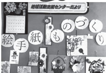
創作活動（絵手紙、ものづくり）